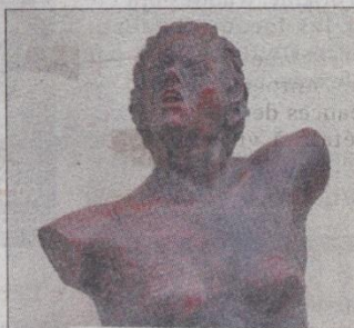
ESPOIR. La Marianne est volontaire, la tête haute.

Le sculpteur a travaillé sur la Marianne essentiellement durant